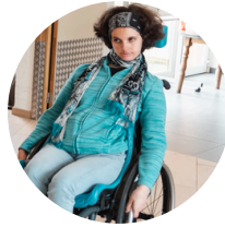
Célie : 39 ans