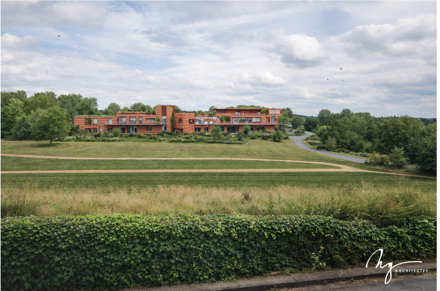
Quartier des Bruyères, Avenue des Arts

Le bâtiment sera construit dans le quartier des Bruyères à Louvain-la-Neuve. D'une superficie totale d'environ 4 600 m 2 sur deux niveaux, il intègrera les unités de vie, un accueil de jour, des espaces de soins, des salles d'activités modulables et des espaces multisensoriels.